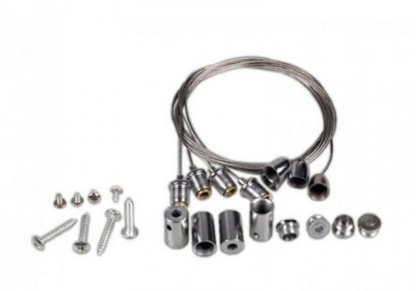
Tabla de Referencias