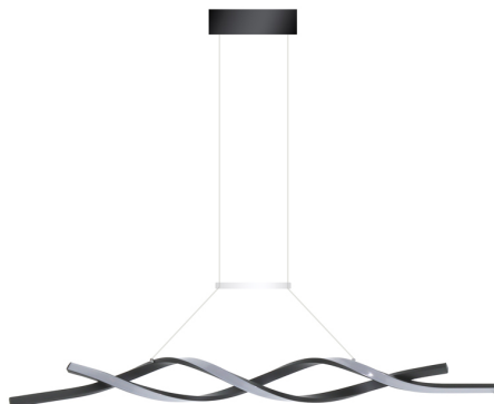
Tabla de Referencias