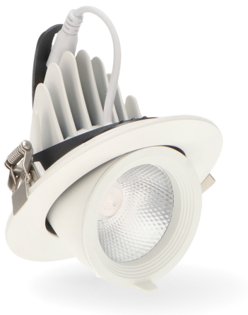
Tabla de Referencias